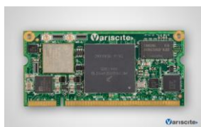
VAR-SOM-SOLO CPU: Freescale iMX6 1.0 GHz Single Cortex-A9