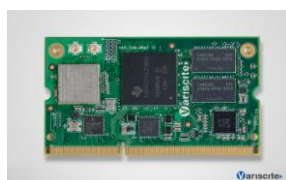
VAR-SOM-AM43 CPU: TI AM437x 1.0 GHz Cortex-A9