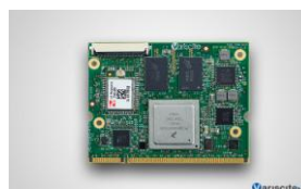
VAR-SOM-MX6 CPU: Freescale iMX6 1.2 GHz Quad/Dual/Single Cortex-A9