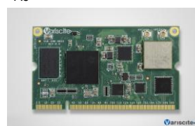
VAR-SOM-AM33 CPU: TI AM335x (AM3354, AM3352) 1 GHz Cortex-A8