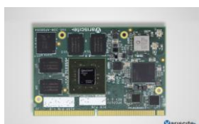
VAR-SOM-SD600 CPU: Qualcomm Snapdragon600 1.7 GHz Quad Krait