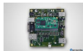
VAR-AM33カスタムボード Supporting the VAR-SOM-AM33